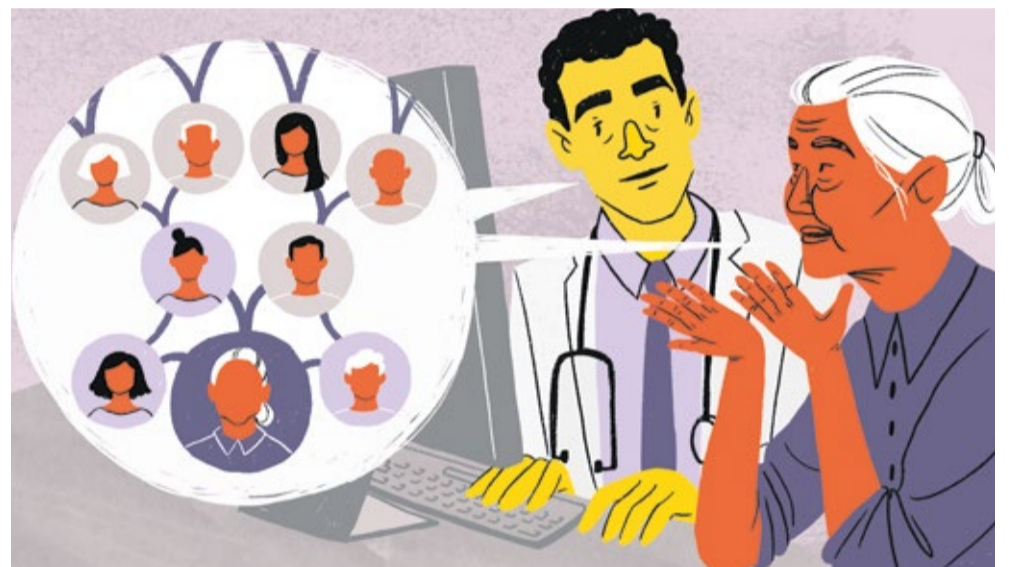
Illustratie: Sidsel Sorensen - Ikon Images

De vraag is relevant voor patiënten én zorgverleners. Voor patiënten begint het bij het stellen van de vraag: “Waarvoor leef ik?” Het herkennen van het verlangen naar betekenis kan het begin zijn van een pad naar een meer vervuld leven. Voor zorgverleners vraagt het om de bereidheid om verder te kijken dan de medische protocollen en in plaats daarvan met open hart te luisteren naar wat er werkelijk leeft bij de patiënt. Het gaat om ruimte maken voor de persoonlijke verhalen, verlangens en dromen die in de spreekkamer vaak onbenoemd blijven. Dit vraagt om kwetsbaarheid, maar