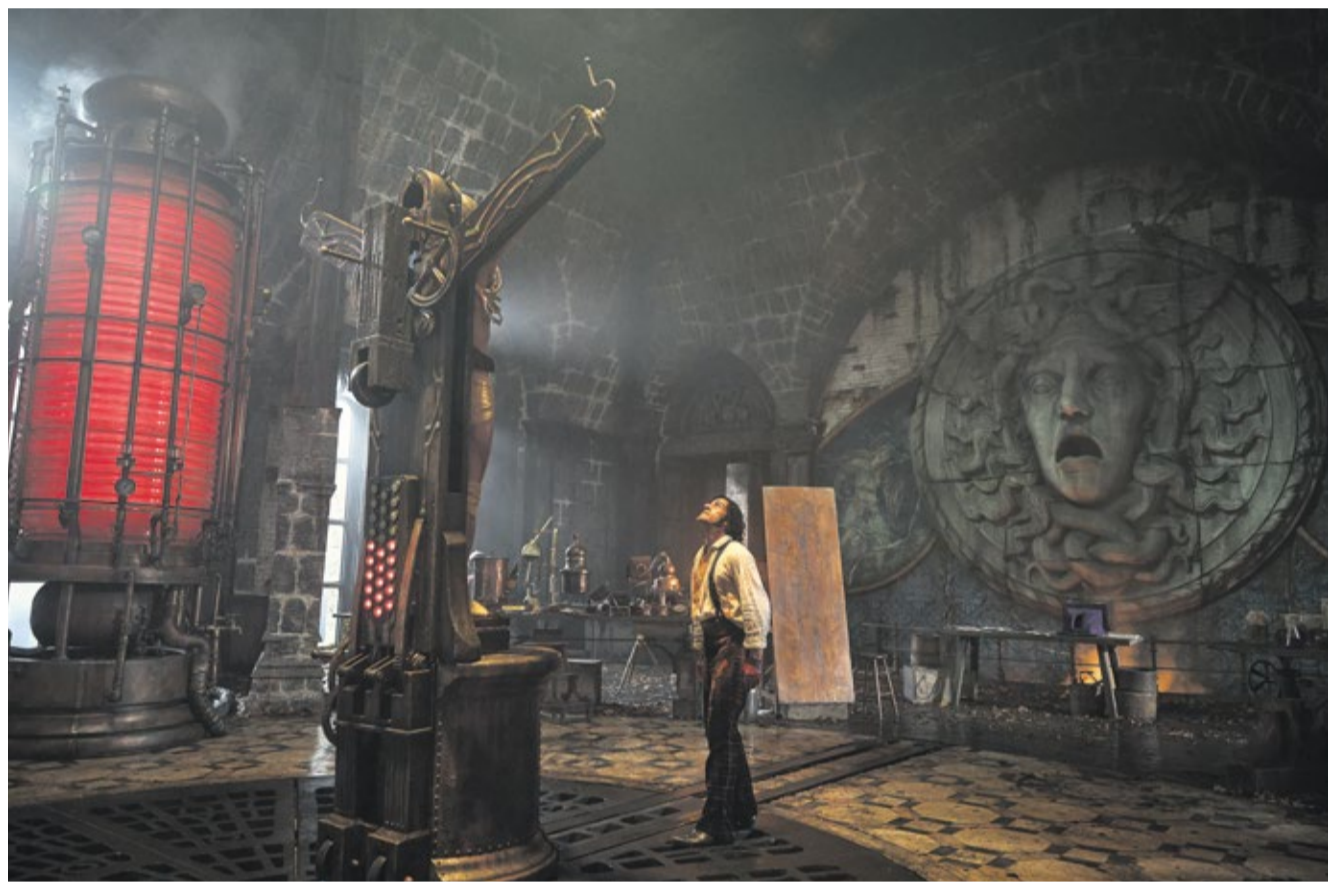
'Het monster van Guillermo Del Toro wordt veel christelijker gevormd dan het monster van Mary Shelley'

Haar belangrijkste literaire invloed putte zij daarvoor