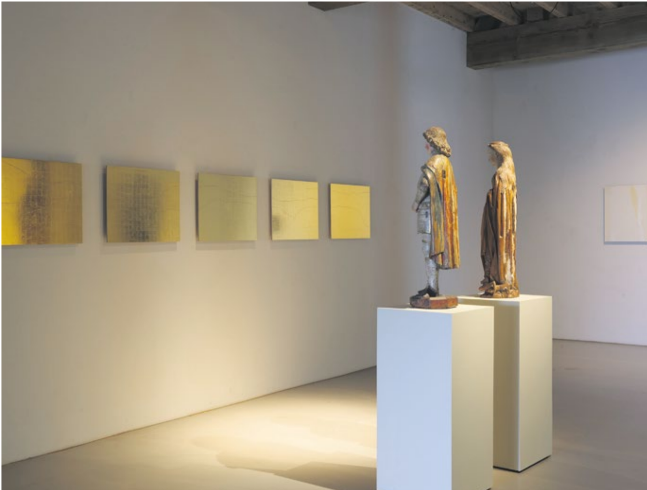
In 'Kleuren van de regenboog' combineert Charlotte Caspers laatmiddeleeuwse beelden met eigen werk.