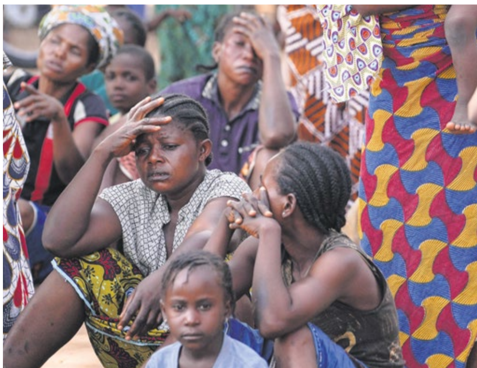
Mensen treuren na een terreuraanslag in de Nigeriaanse deelstaat Benue op 16 juni 2025.

Verschillende Nederlandse media, waaronder de NOS en ND , publiceerden vervolgens artikelen waarin Trumps acties beschreven werden en de situatie in Nigeria onder de loep genomen werd. Volgens de NOS “vertellen de cijfers een genuanceerder verhaal” over christenvervolging in het Afrikaanse land. Volgens de NOS zijn de slachtoffers van jihadistische terreurgroepen “vooral mensen met een islamitische achtergrond”, aangezien het geweld vooral in het overwegend islamitische noorden plaatsvindt. Daarnaast is religie niet de enige factor die een rol speelt in het conflict, aldus de NOS . Het medium citeert veiligheidsanalist Ikemesit Effiong van SBM Intelligence : “Er spelen veel factoren mee: de economische crisis, hoge werkloosheid, klimaatverandering en het historische onvermogen van Nigeria om zijn burgers te beschermen. Alle inwoners, niet alleen christenen” worden daardoor geraakt. Op 4 november reageerden vervolgens de christelijke organisaties Open