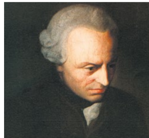
Immanuel Kant

Diaken en filosoof René de Weerd spreekt over 'Autonomie, de filosoof Kant en de Verlichting'. In een tijd waarin zelfbeschikking en autonomie centraal staan, gaat hij in op de betekenis, mogelijkheden en grenzen van deze idealen. Tijd: 20.00 uur. Locatie: Parochiecentrum (Rodenborchweg 2). Info: birgittabijeenkomsten.blogspot.com