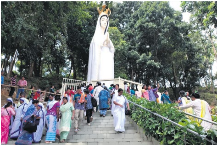
Pelgrims uit heel Bangladesh komen elke oktober naar Fatima Rani. Dit jaar viert het Mariaheiligdom zijn vijftiengste verjaardag.