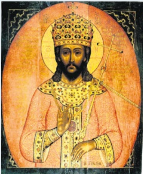
Aleksandr Kazantsev, icoon van Christus Koning.

Christus, koning van het heelal Eerste lezing: 2 Sam. 5,1 - 3 Tweede lezing: Kol. 1,12 - 20 Evangelie: Lc. 23,35 - 43 (Wit)