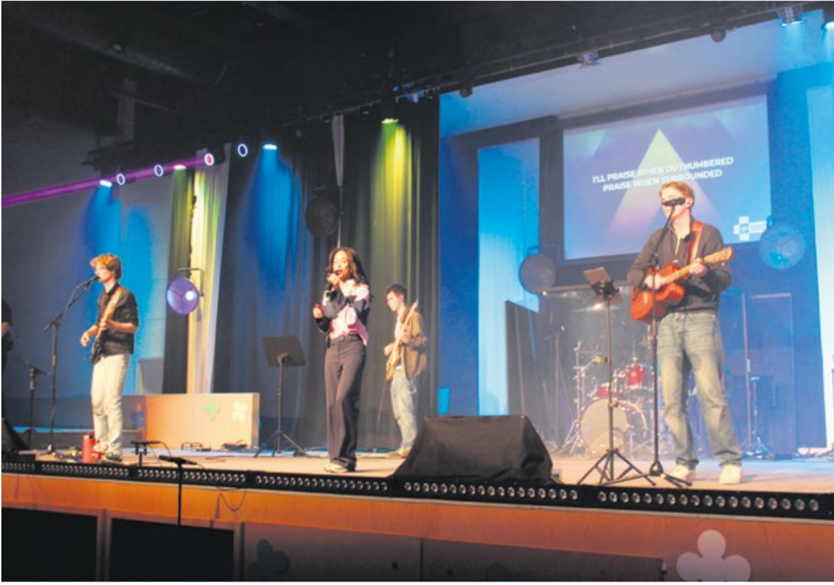
De band Mountain and the Mustard Seed trad op voor een feestelijke afsluiting van een geslaagde KJD.

‘We komen handen tekort, maar al een paar mensen hebben aangegeven dat ze volgend jaar willen helpen’