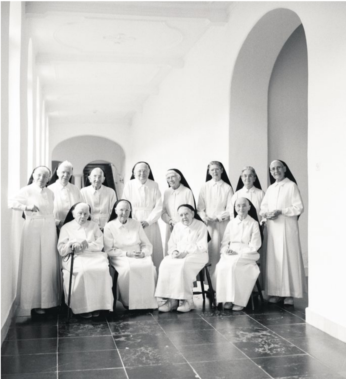
De norbertinessen van Oosterhout.

de Moderne Devotie, de stichting van Soeterbeeck in ongeveer 1448, de Gelderse Oorlogen, de Tachtigjarige Oorlog, de Franse tijd in Nederland, waarbij in 1812 op bevel van Napoleon Soeterbeeck en andere kloosters in de omgeving verboden werden. In 1840 staat koning Willem II het toe dat er weer novices aangenomen worden. Van daaruit wordt Soeterbeeck groter en groter, met een nieuwe kloosterkerk en een extra verdieping. Uiteindelijk verhuizen in 1997 de zusters naar verzorgingstehuis Sint-Jozefoord in Nuland en schenken zij hun klooster aan de Katholieke Universiteit Nijmegen. In 2023 is de laatste zuster overleden.