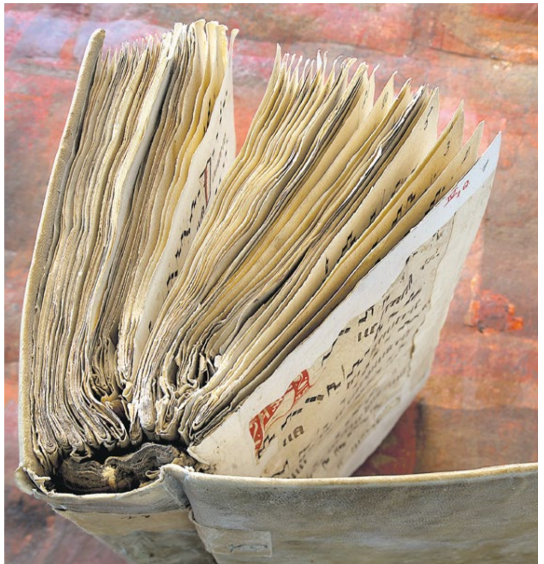
Een van de boeken uit de expositie 'Graven in boeken'.

De drievoudige expositie opent met 'Kleuren van de regenboog' van de Vlaams-Nederlandse kunstenares Charlotte Caspers, die in oktober op televisie verscheen met haar serie Kijken met Caspers . In de eerste hal staan drie prachtige beelden uit de periode 1460-1470 van respectievelijk de heilige Michaël, de heilige Catharina en een verder onbekende vrouwelijke heilige. Alle drie van notenhout en gepolychromeerd. Caspers heeft ze intensief bestudeerd en vanuit die inspiratie schilderijen gemaakt die op de achtergrond in alle bescheidenheid te bewonderen zijn.